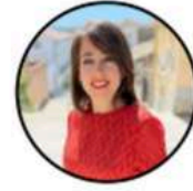
Presidente Olga Cervera