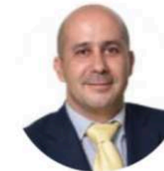
Vocal Cultura y Universidad Fernando Arguis