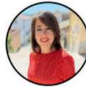
Presidenta Olga Cervera